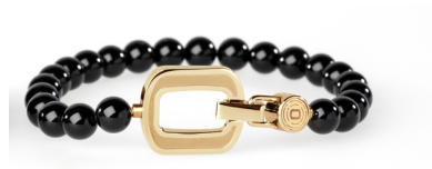
ORGANO Vital Onyx-Armband, Gold